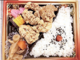
大ぶり唐揚げ 鶏竜田揚げ弁当