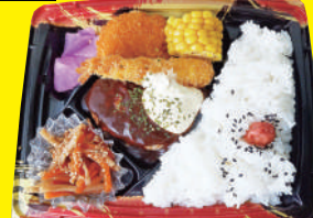
ハンバーグ&エビフライ 洋風弁当