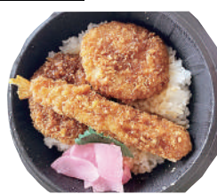
当店オリジナルデミソース ソースミックス丼