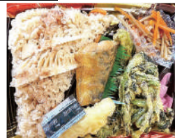
素材の旨味 たけのこ弁当