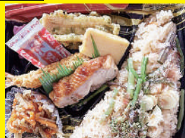
ヘルシー醤油味 山菜弁当